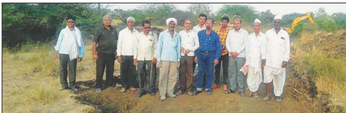
Monitoring by BJS volunteer network