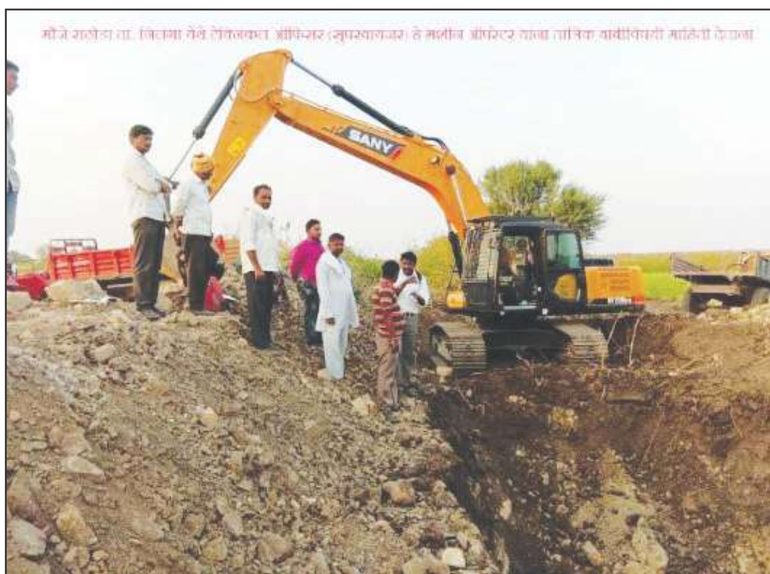
Technical Officer sharing the technical information to machine operators