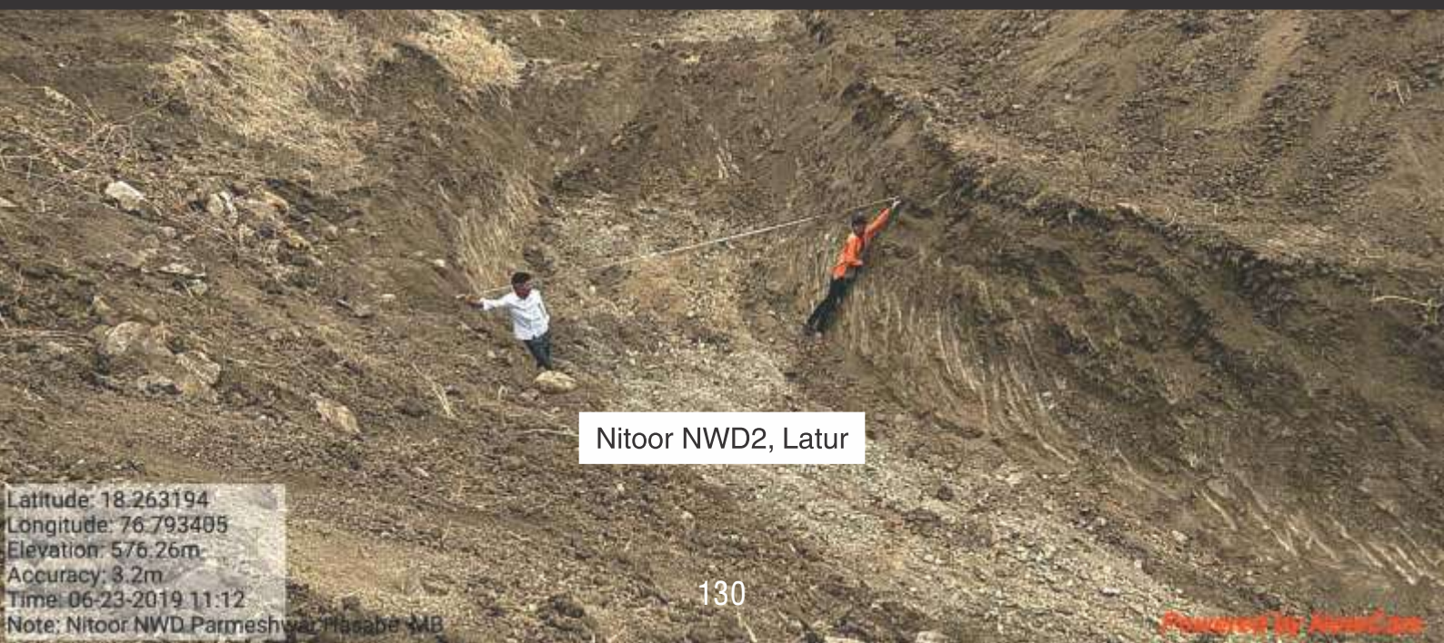
Nitoor NWD2, Latur

Latitude: 18.263194 Longitude: 76.793405 Elevation: 576.26m Accuracy: 3.2m Time: 06-23-2019 11:12 Note: Nitoor NWD Parmeshwar Hasabe MB