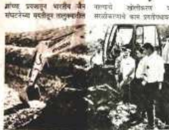
नुजाळ येथे जैन किल्लेभरण्या