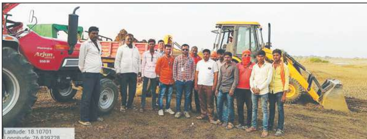
District level monitoring