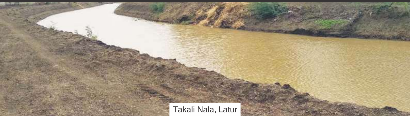
Takali Nala, Latur