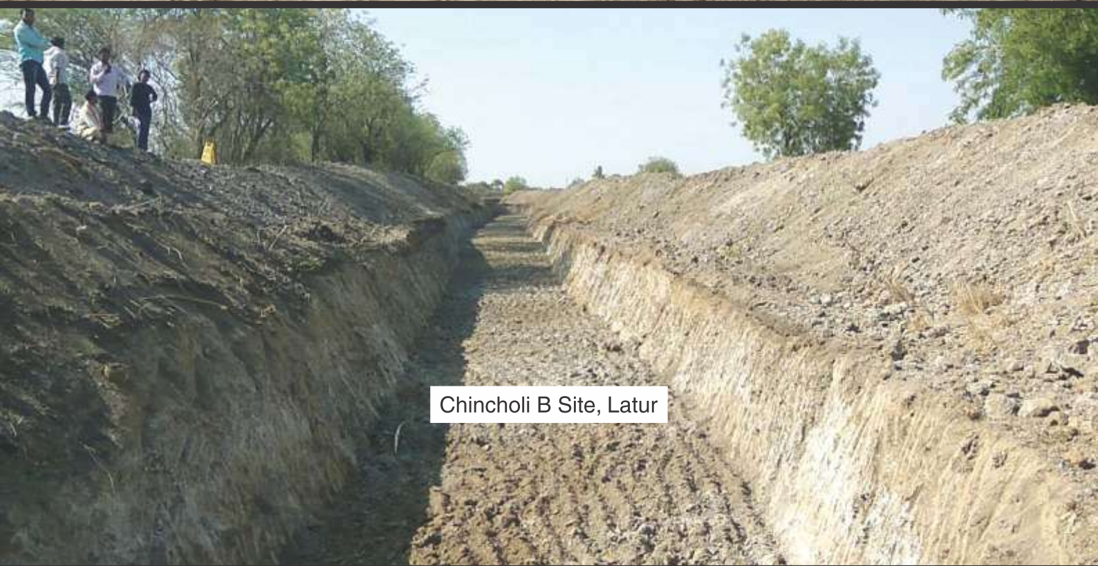
Chincholi B Site, Latur