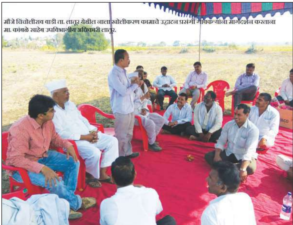
Community mobilisation by District Administration official

BJS and District Administration officials oriented the community about water and soil conservation, earthwork process and benefits out of it in terms of increase in water storage capacity, use of silt for farm productivity and increase in percolation of water and finally the related outcome which will affect their socio-economic life. Community meetings and Gram Panchayat meeting were conducted by District Administration officials, Talukla Committee, and BJS team.