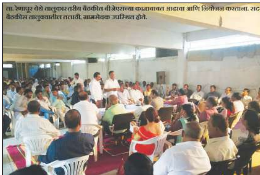
Taluka level monitoring

The whole Government machinery in the district took the lead in the implementation, monitoring and evaluation of the project activities. At the Taluka level daily record were maintained and weekly review meetings were conducted. Hon'ble District Collector organised weekly review meetings under his leadership. Members of BJS volunteer network played a critical role in advocacy and monitoring of the project.