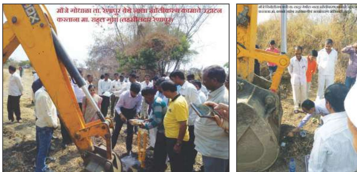
Initiation of earthwork by District Administration official at project site

As suggested by 'Taluka committee' members, District Administration prepared the deployment plan and schedule of earth moving machines. By 02 nd October 2018 all the machines were deployed in the priority project sites.